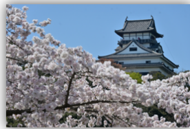
愛大合同撮影会 @犬山城周辺