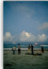
星空撮影会 @伊古部海岸