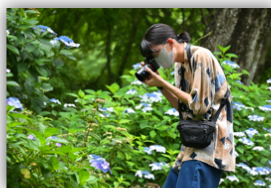
紫陽花撮影会 @普門寺