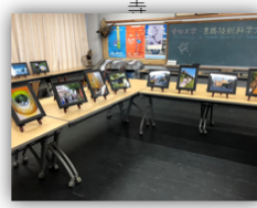
愛大合同写真展 @水上ビル