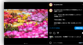
公式Instagramにおける写真投稿