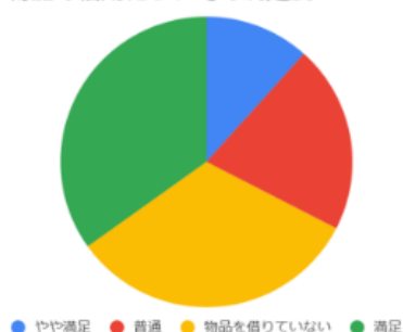
物品の借用についての満足度