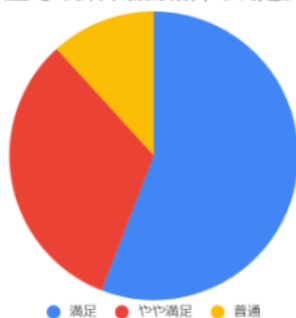
教室での課外活動紹介の満足度